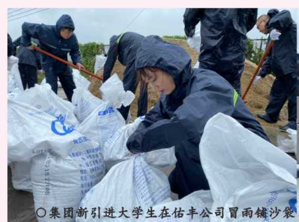
集团新引进大学生在恒平公司冒雨铺沙袋