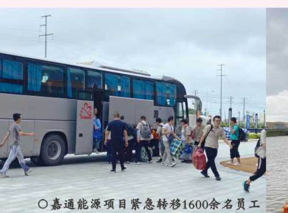
嘉通能源项目紧急转移1600余名员工